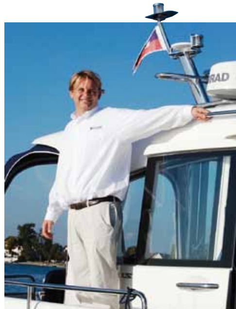
Über die großen Schiebetüren (o. r.) lassen sich Vorschiff und Seitendecks schnell vom Steuerstand aus erreichen

Bei den meisten Werften gehört das Ver- kaufen von reichlich Zusatzausstattung zum Geschäftsmodell. Punkt. Bei diesem „Upselling“ genannten Prinzip sucht sich der Kunde alles das gegen Aufpreis aus, was sein neues Boot schöner macht – und scheinbar nur das, was er wirklich braucht. Wenn die Basisversion eines ver- meintlichen Neuboot-Schnäppchens aber so knapp bemessen ist, dass Bootfahren keinen Spaß macht (oder mangels BSH- komformer Lampen hier zu Lande schlicht- weg nicht zugelassen ist), ergibt sich in Wirklichkeit ein ganz anderer Preis.